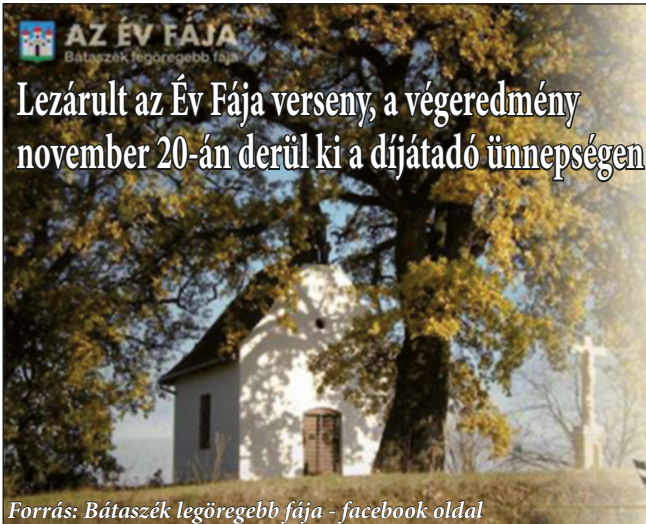
Forrás: Bátaszék legöregebb fája - facebook oldal

Ezúton szeretnénk megköszönni mindenkinek a támogatást határon innen és határon túl, a sok befektetett energiát, a szavazótoborozást, a megosztásokat és a lelkesítést a hosszú kampányidőszak alatt, mely újra és újra erőt adott a folytatáshoz! A verseny végkimenetelétől függetlenül páratlan összefogásról tett tanúbizonyságot kis közösségünk. Bízunk benne, hogy lehetőséget kapunk a nemzetközi versenyen való részvételre, ahol még szélesebb körben kell népszerűsíteniünk a BÁTASZÉKI ÖREG MOLYHOS TÖLGYET!!!