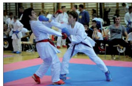
Rekordlétszám és parázs küzdelmek a XII. Cikádor Kupán