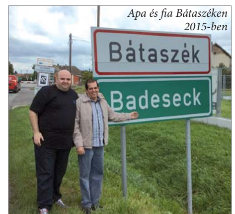
Apa és fia Bátaszéken 2015-ben

Steinek több fényképet is hoztak magukkal, köztük egy Bátaszéken, több mint száz évvel ezelőtt készültet is. (RLO)