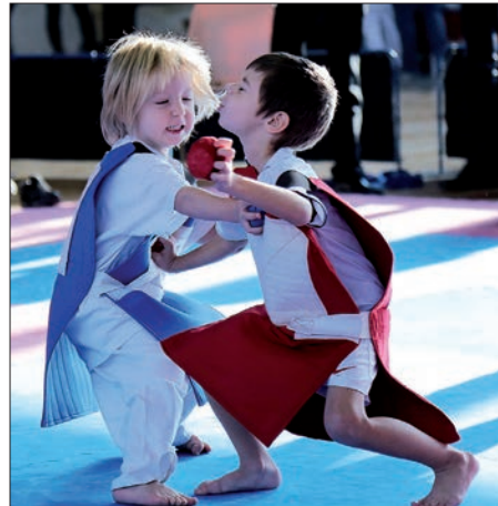
A házi bajnokságon az ovisoké volt a főszerep

Igazi nagy falattal zártuk a szezon és kizárólag egy célnak szerettünk volna megfelelni. Egy két fős csapattal nevez-