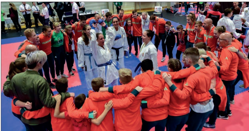
A magyar válogatott a női csapatot ünnepli

Bátaszék SE szervezői stábjá ilyen volumenű rendezvényt még soha nem bonyolított le. Másrészt az egyesület versenyzői történelmi tettet hajtottak végre, hiszen ilyen mennyiségű stílus EB érmet még soha nem sikerült a csapatnak produkálnia a 11 országot és több mint 500 versenyzőt, (majd 800 nevezést) felvonultató WadoKai topmezőnyben.