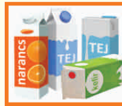
ITALOS KARTONDOBOZOK: TEJES, GYÜMÖLCSLÉS LAPITVA, KIÖBLÍTVE