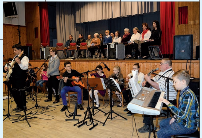
Nagypénteki istentisztelet a művelődési házban az ifjak zenei szolgálatával

Minden korosztályt szeretettel hívunk alkalmainkra a református imaház nagytermébe. FELNÓTT ISTENTISZTELET ÉS A BÁRÁNYKÉPZŐ GYERMEKALKALMAK – VASÁRNAP 10:30, NŐI KÖR – KEDD 17:00, FÉRFIKÖR – KEDD 18:30, CSEPPECSKE BABA-MAMA KLUB – KÉTHETENTE KEDD 10:00 (ápr. 19., máj. 3., 17., 31.), OFF/ON IFJÚSÁGI ZENÉS ALKALOM – PÉNTEK 18:00. Gyülekezeti hírek, események: www.facebook.com/bataszekreformatus a közösségi alkalmak felvételeit – köztük az ifjak zenei szolgálatát nagypénteken – itt tekinthetik meg: www.youtube.com/user/abreformatus az AB.REF KÖZÖSSÉGI ÉLET lejátszási listán.