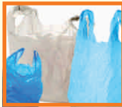
MŰANYAG SZATYOR: EGYSZERHASZNÁLTOS, VOLT HIPERMARKETES