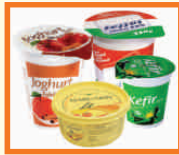
MŰANYAG FLAKONOK: TEJFŐLŐS, JOGHURTOS, VAJAS