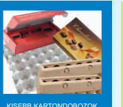
KISEBB KARTONDOBOZOK LAPITVA (CSOKOLADÉS, TOJÁSTARTÓ, STB.)