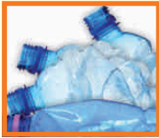
MŰANYAG PALACK: ÁSVÁNYVIZES, ÜDÍTŐS, BOROS

Kérjük, hogy a szelektív hulladékgyűjtő edényét a megfelelő szállítási napokon reggel 6 óráig szíveskedjen kihelyezni az ingatlan elé úgy, hogy az a közúti forgalmat ne zavarja! A szelektív hulladékgyűjtő gépjármű elhaladása után, késve kihelyezett edényeket nem áll módunkban üríteni.