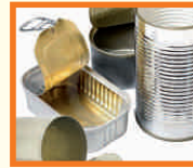
HÁZTARTÁSI FÉM: KONZERVDOBOZOK, KISEBB FÉM TÁRGYAK