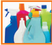
MŰANYAG FLAKONOK: TUSFÜRDŐS, MOSÓSZERES, ÖBLÍTŐS