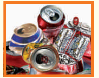
ALUMÍNIUM ÜDÍTŐITALOS ÉS SÖRÖS DOBOZOK

Felhívjuk a figyelmüket, hogy minden hulladék TISZTÁN, SZENNYEZŐDÉSTŐL (étel- és vegyszermaradékoktól) MENTESEN helyezhető az edénybe!