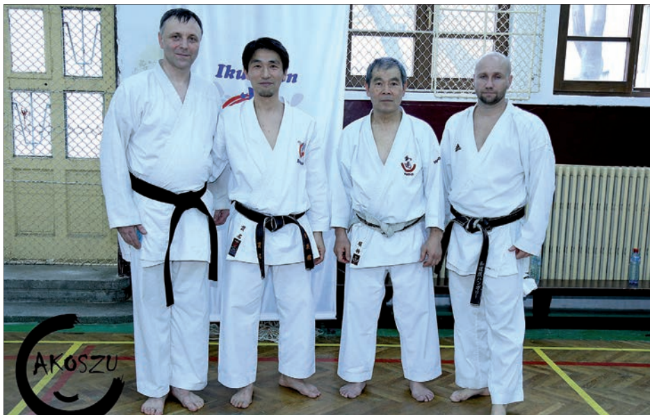
Mestereinkkel a bukaresti szemináriumon

riumon más országok, ír és osztrák barátaink is jelen voltak. Nagyon örültünk, hogy rég nem látott barátainkkal ismét eltölthetünk néhány napot, izzadságos órákat. Sakagami Mester öt kétórás edzést tartott a hétvége során. Az első edzéseken tanuló katók és páros gyakorlatok, később magasabb szintű tradicionális páros gyakorlatok és mester katók kerültek a gyakorlás középpontjába. A gyakorlatok mellett több, az alapokat erősítő gyakorlatot csináltunk. A mester interaktív és logikus edzésmetodikája igazi csemege volt. Azt hiszem, ezekre a találkozásokra mondhatjuk: fekete övtől kötelező anyag. Sakagami és Nukina Mesterrel még több ízben találkozhatunk az évben. Május végén Nukina Mester tart hétfői szemináriumot Budapesten és Bátaszéken, júliusban pedig igazi nagy durranásra készülünk Gyomaendrődön. Július 25–31. között Sakagami, Peter May és Nukina Mester vezetésével tartunk egyhetes edzőtábort. Mindhárman az Európai Wadokarate vezérégenységei.