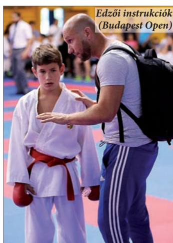
Edzői instrukciók (Budapest Open)