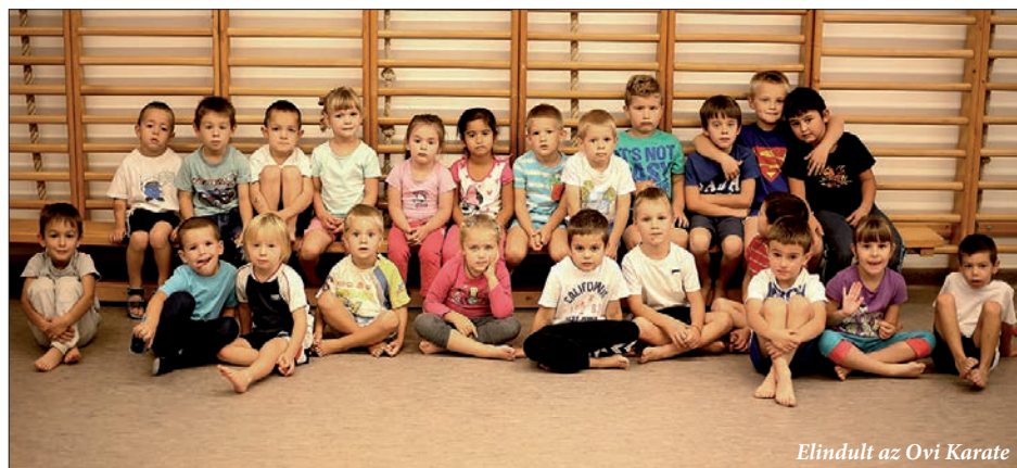
Elindult az Ovi Karate