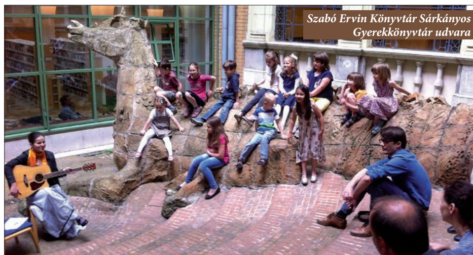
Szabó Ervin Könyvtár Sárkányos Gyerekkönyvtár udvara

„Mi lenne, ha...” címmel rajzpályázatot írt ki a könyvtár hazai és határon túli magyar iskoláknak . A cél az volt, hogy a diákok fantáziáját beindítsa az elkezdett mondat és rajzolják meg saját gondolataikat. Majd írók, költők írjanak verset, prózát a képekhez. A pályázók határtalan képzeleterejét igazolja a https://milennehablog.wordpress.com/page/8/ oldalra feltöltött 920 rajz. Hét gyermekkönyvíró zsűrizte a munkákat. Először a legérdekesebb 99-et