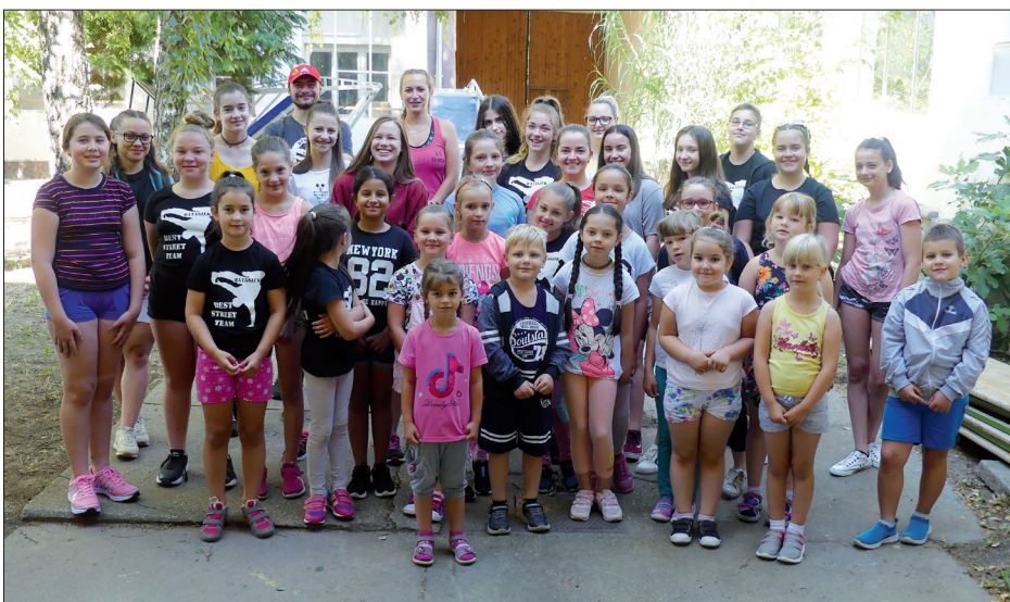
A BST táborozó gyerekei