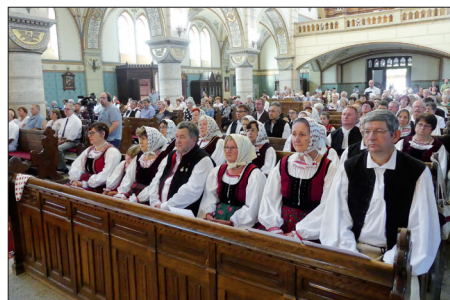
Ünnepi mise a Józseffalvi Búcsún