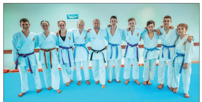
A sikeres vizsgázók a mesterrel

Kiadványunk Bátaszék város honlapján is megtalálható: WWW.BATASZEK.HU