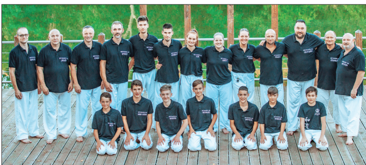
A BSE gyomaendrődi táborozói