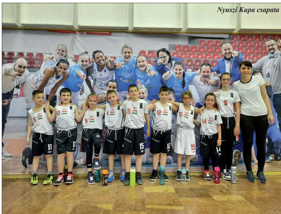
Nyuszi Kupa csapata

Az utolsó fordulóra hazai pályán került sor, ami sajnos csapatunknak mégsem volt hazai pályá.