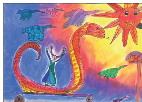
Sallai Regina minisztériumi különdíjas rajza