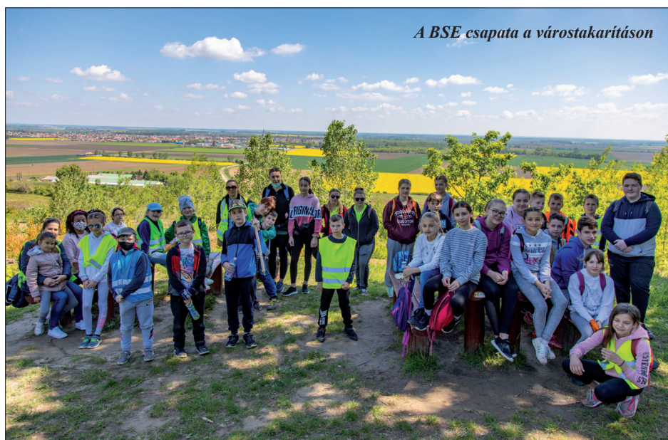
A BSE csapata a várostakarításon