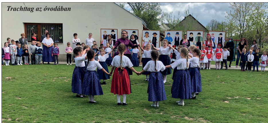
Trachttag az óvodában

A májusi ünnepi rendezvényekről csak a következő lapban tudunk beszámolni. Hasonlóképpen a folyamatban lévő, és már nyertes, de módosított pályázatokról is ezután tudósítunk. ESJ