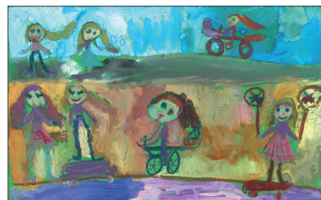
Fábíán Lilla különdíjas rajza