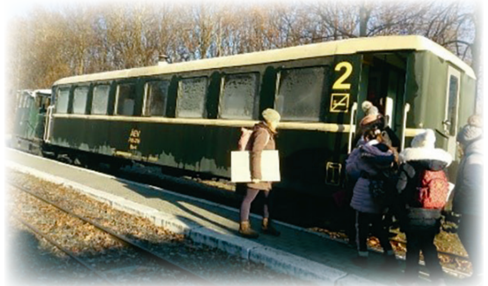
A hidegre való tekintettel zárt kisvonattal indultunk el Rezetre

A túránk elején lábnymokat kerestünk, és találtunk is. A túránk során „állatosat” játszottunk, amely során megismerkedtünk az itt élő állatcsaládokkal, megtanultuk a szülők és a kicsinyeik nevét, utánóztuk a hangjaikat, megbeszéltük az életmódjukat, a szokásaikat. Miatán megbeszéltük, megtanultuk a róka, a