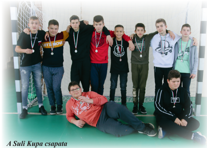
A Suli Kupa csapata