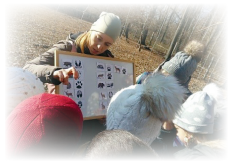
Lábnym és a tulajdonosának felismerése

Egy fagyos novemberi, szerdai reggelen kirándulni mentünk az osztállyal Pörböllyre, az erdei iskolába.