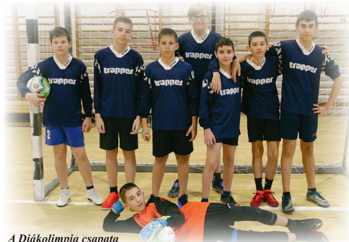
A Diákolimpia csapata