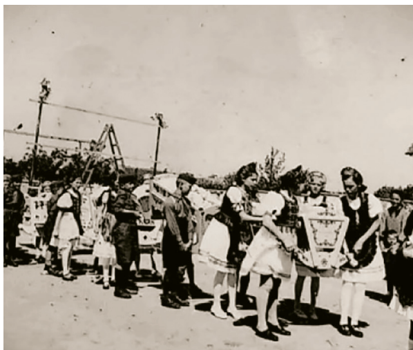
Indulnak a bölcsők a templomba