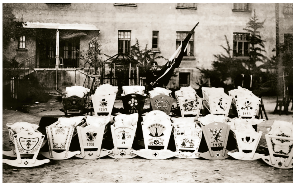
A bátaszéki diákok által készített 16 bölcső

Kiadványunk Bátaszék város honlapján is megtalálható: WWW.BATASZEK.HU