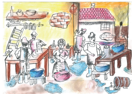
Sümegi Botond rajza