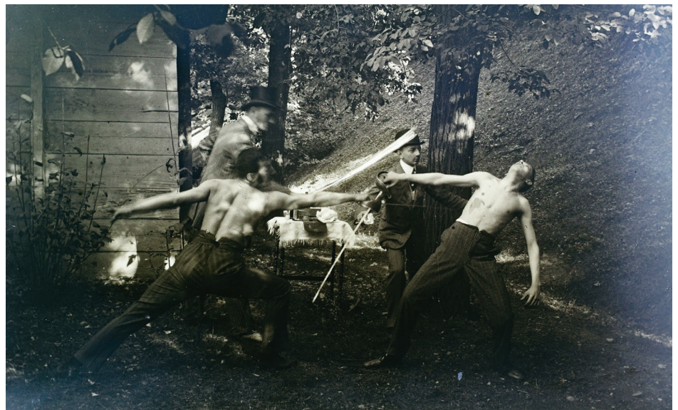
Kardpárbaj 1909-ben.

re kiterjedő jegyzőkönyvet vettek fel, és ezzel az ügyet elintézték tekintették. Szintén jegyzőkönyv készült, ha a párbaj azért hiúsult meg, mert az egyik fél nem jelent meg a megbeszélten helyen és időben. Ilyenkor még az is előfordult, hogy a helyi lapban hirdetésben közölték, hogy X.Y. nem volt hajlandó elégtételt adni, nem jelent meg a párbaj helyszínén, ő tehát „egy gyáva fráter”. Az ilyen „gyáva fráterek” gyakorlatilag kizárták magukat a társaságból. Szintén kizárták magukat a társaságból, a továbbiakban párbajképtelenségnek számítottak azok, akik valamely lovagias ügy kapcsán civil hatósághoz fordultak, például párbajban szerzett sérülés miatt a rendőrségen feljelentést tettek!