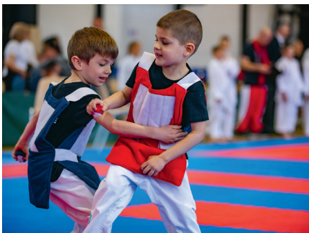
Hosszú idő után ismét OviKaratekák léptek tatamira

A versenyen a BSE mellett, három regionális klub vett részt a Tolna-Fadd Tanren Karate Klub, a Mohácsi TE Karate