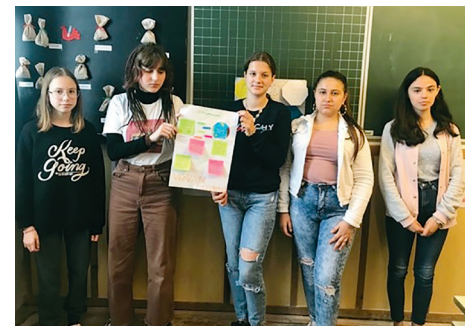
Az 5.a osztályos tanulók a Víz témahéten, a víz világnapja alkalmából készült plakáttal