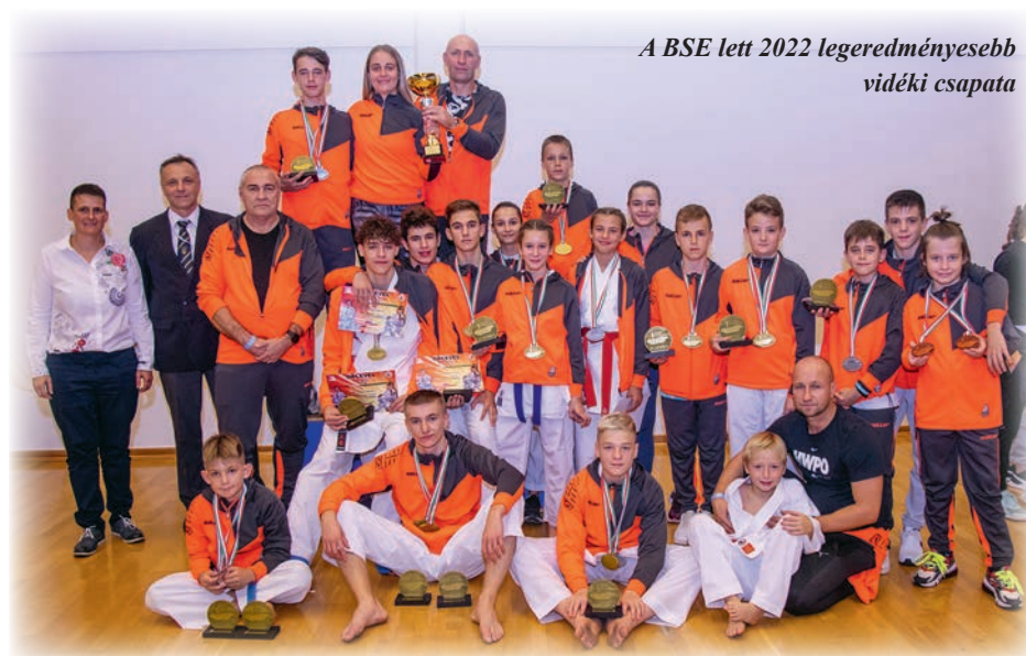
A BSE lett 2022 legeredményesebb vidéki csapata