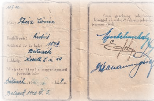
A Hűségmozgalom egy bátaszéki tagjának igazolványa

adott 20-20 díszlövessel tisztelegtek a 3. Ukrán Front teljesítménye előtt. Sztálin parancsában valóban ott szerepelt településünk neve („A támadás folyamán a 3. Ukrán Front csapatai elfoglalták Pécs, Bátaszék és Mohács városokat.”), de Bátaszék elfoglalásánál vélhetően sokkal fontosabb fegyvertény volt a mohácsi hídfő néhány nappal korábbi kiépítése –