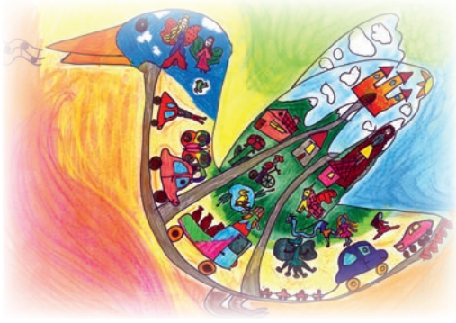
Sallai Regina rajza