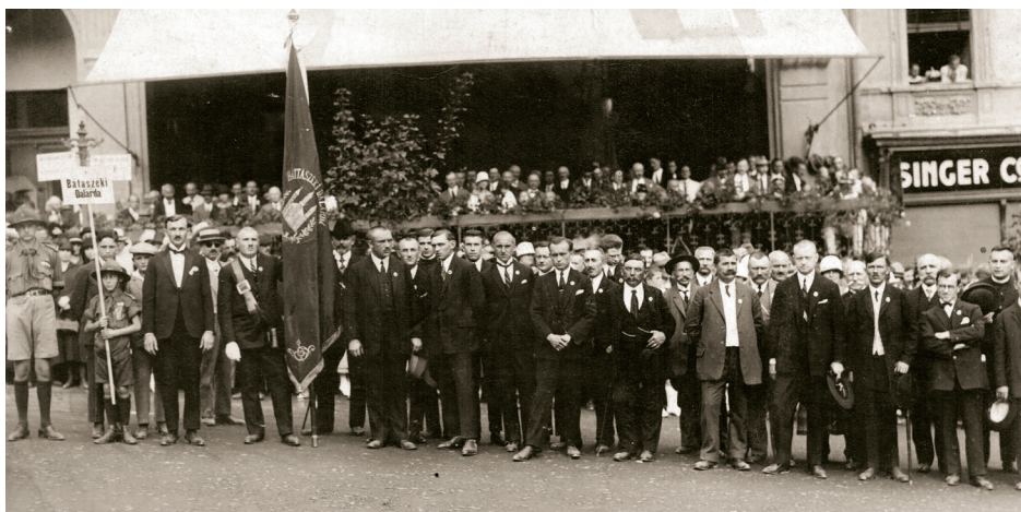
A Bátaszéki Dalárda. A felvétel 1926 augusztusában, a pécsi Dalárnapon készült. (Gaszner Ferenc gyűjteményéből)

maságokra is kiváló gondot fordítottak. A dalárdisták erre az alkalomra valamilyen egyforma ruhát öltöttek és szalonöltöny, fehér nyakkendő, fehér kesztyű, fekete Kossuthkalap vörös tollal, jelentette, hogy nem mindennapos eseményre készül a dalárda”. Ekkor „csak” díszoklevelet kapott a dalárda, ez Bátaszéken mégis akkora elismerést váltott ki, hogy a vasútállomáson tömeg, a község apraja-nagyja két helyi zenekarral kiegészülve várta a hazatérő dalnokokat. Három évvel később, 1889-ben részt vettek a szegedi Dalárnapon is: „szépen, arányosan, bár