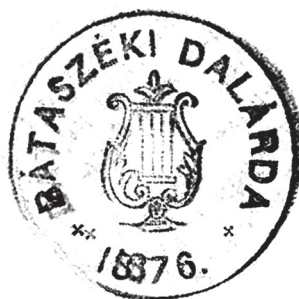
A Bátaszéki Dalárda bélyegzője