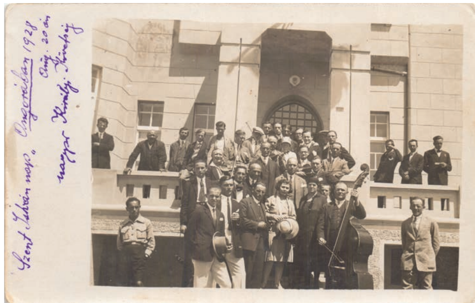
„Szent István nap Angórában, 1928. aug. 20-án, magyar Királyi Követség”