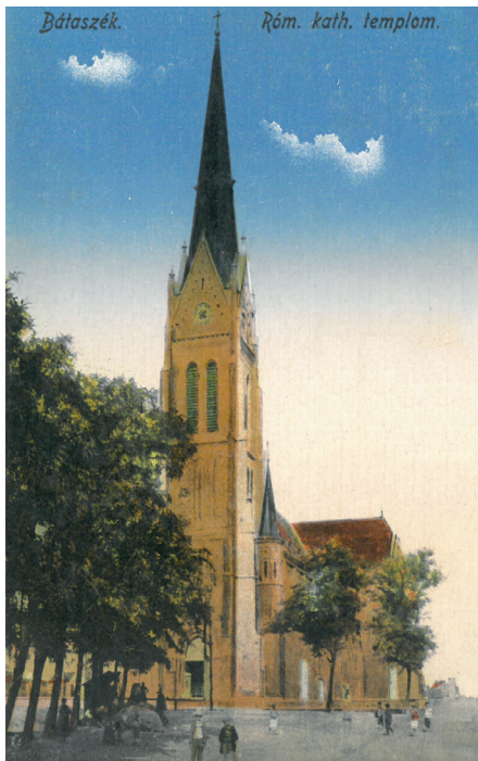
Bátaszék. Róm. kath. templom.