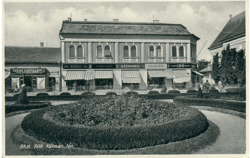
Baja, a Risztics-ház az 1930-as években, a későbbi „nagysemege”

A 2011-es Tihanyi Kalendáriumában olvasható írás szerint a bátságéki kőművesek „forradalmi változást hoztak a tihanyi kőépítésbe. Ugyanis az eddig