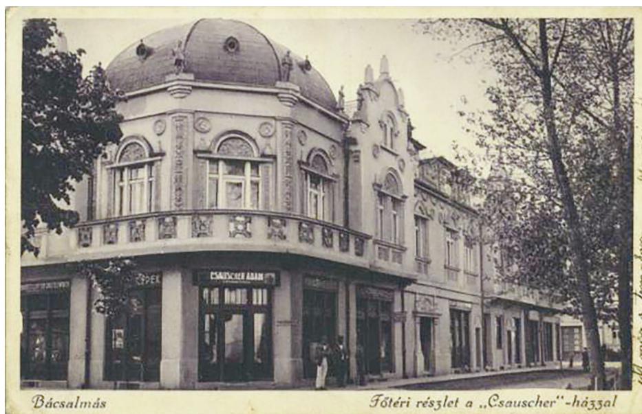
Bácsalmás, a Csauscher-ház