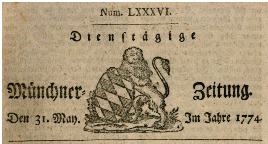
A Münchner Zeitung 1774. május 31-i fejléce

A delegáció ellátásához naponta a következő élelmiszerekre volt szükség: 3 birka, 3 bárány és 10 tyúk a legjobb fajtából. 6 okka (7,7 kg) liszt, 10 liter édes és 10 liter savanyított tej, 3 liter ecet, 50 darab tojás, 1 okka (1,3 kg) búzadara, 5 font (2,5 kg) só. Megfelelő mennyiségű