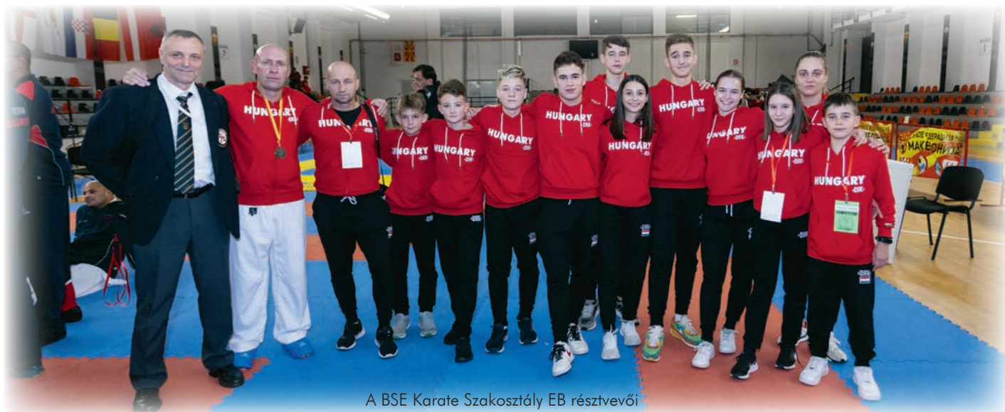
A BSE Karate Szakosztály EB résztvevői