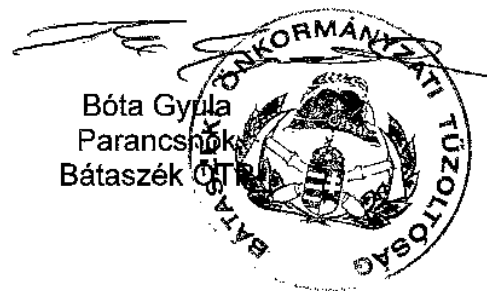
Bóta Gyula Parancsnok Bátaszék ÖTP