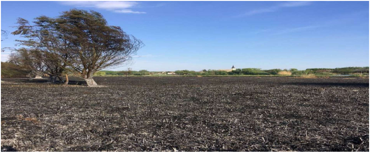
1. sz. kép: Bogyiszló külterület, nádas, avar gaz

és kéziszerszámok segítségével oltották el több mint 4 óra leforgása alatt. A kialakult tűz olyan intenzitással égett, hogy több egyéni védőfelszerelés is tönkrement a nagy hőterheléstől.