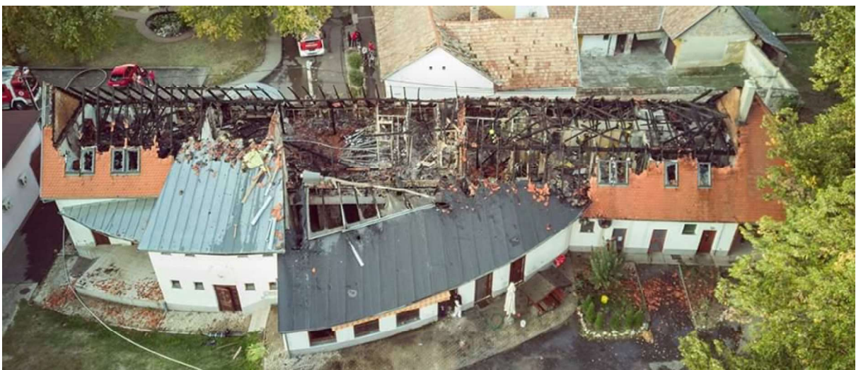
2. sz. kép: Szászvár Fogadó és Faluház

Október 08-án délután Szászvár településről jelentettek tüzet, ahol a Fogadó és Faluház tetőszerkezete és a tetőtér beépítéses panziórész tárgyai égtek teljes terjedelmében. A tüzet több mint 6 óra alatt sikerült eloltani.