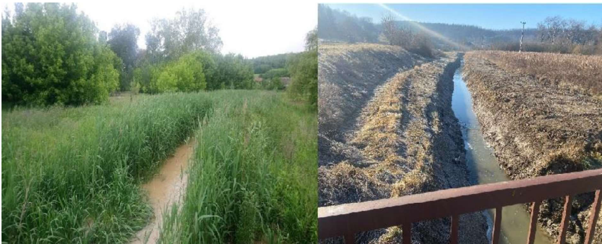
3. sz. kép: Mucsi-Hidas patak meder rendezés (előtte-utána)

Kisdorog településen áthaladó Mucsi-Hidas patak a tavasszal többször bekövetkezett hirtelen lezúduló nagy mennyiségű csapadék miatt a vizet nem volt képes elvezetni megfelelően, így a patak medréből kilépett és veszélyeztette, károsította a mellette található lakóingatlanokat. Ennek fő oka az volt, hogy a patak medre évek óta nem volt karbantartva, az növényzettel benőtt és feliszapolódott volt. A kialakult helyzet megszüntetése érdekében soron kívül felvettük a kapcsolatot a Mucsi-Hidas patak üzemeltetőjével és egyeztetéseket kezdeményeztünk a kialakult helyzet megszüntetésére. Az egyeztetések hatására a karbantartási munkálatokat elvégezték.