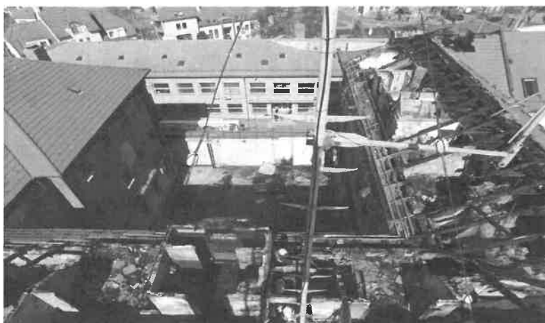
1. sz. kép: Szekszárd, Béla király tér 4.

Március 16-án Szekszárdon, a Tolna Megyei Büntetés-végrehajtási Intézet tetőtere, tetőszerkezete égett.