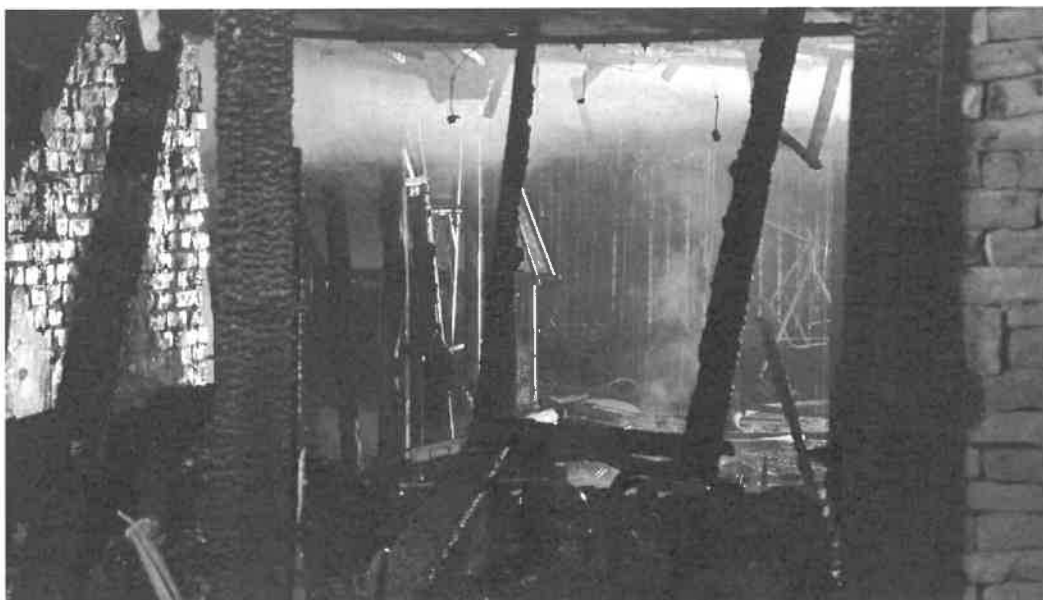
1. sz. kép: Szekszárd, Bródy köz 20.

Március 11-én Szedres, külterület, 15 hektáron nádas, sásos, bokros, fás terület égett, fokozat: II/K.