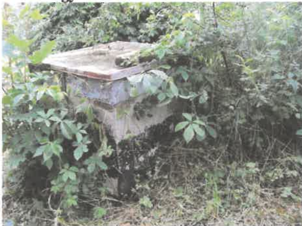
Az egyik víztározó föld feletti része